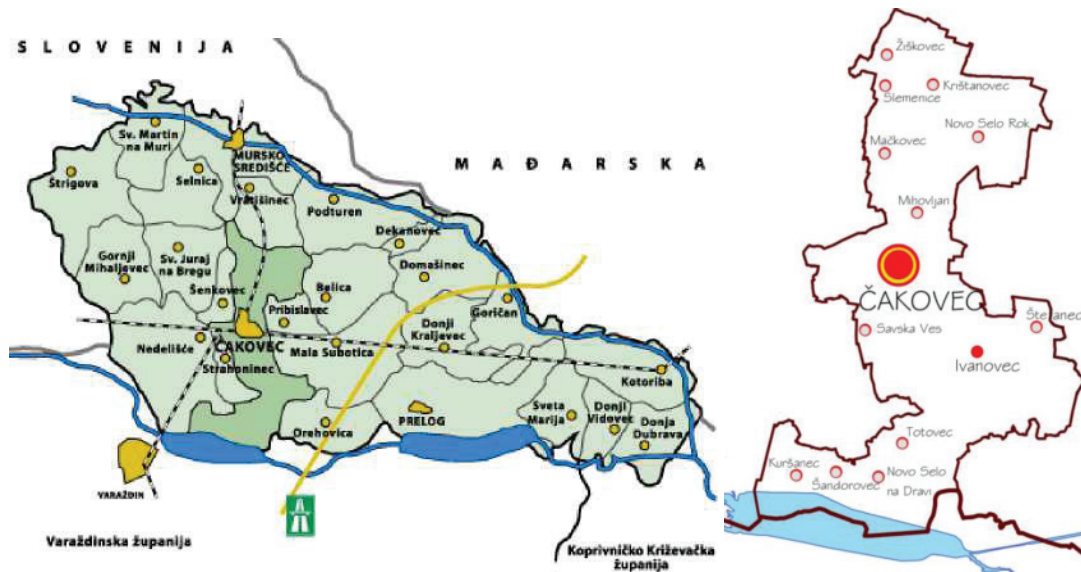
Slika 1: Položaj Grada Čakovca u Međimurskoj županiji i položaj naselja unutar Grada

Upravni odjel za komunalno gospodarstvo, izgradnju grada i upravljanje nekretninama Grada Čakovca, kao izvršno tijelo, sukladno zakonskoj obavezi iz članka 173., stavka 3. Zakona o gospodarenju otpadom (NN 84/21, 142/23) izrađuje godišnje Izješće o provedbi Plana gospodarenja otpadom Grada Čakovca za 2023. godinu . Navedenom odredbom Zakona propisano je da jedinica lokalne samouprave dostavlja godišnje izvješće o provedbi Plana gospodarenja otpadom jedinici područne (regionalne) samouprave do 31. ožujka tekuće godine za prethodnu kalendarsku godinu i objavljuje ga u svom službenom glasilu.