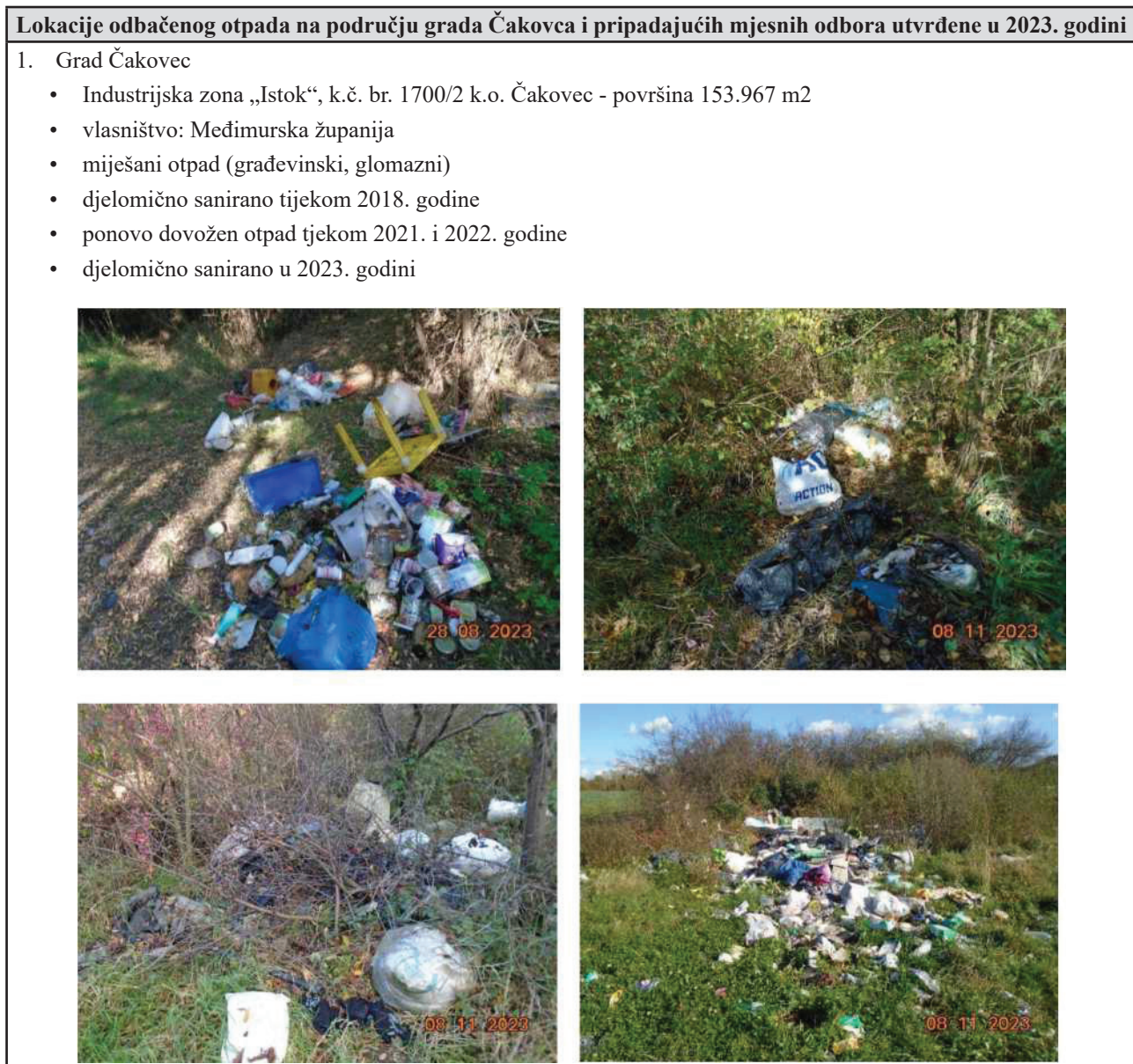
Slike 3.: Pregled lokacija odbačenog otpada utvrđenih nadzorom tijekom 2023. godine