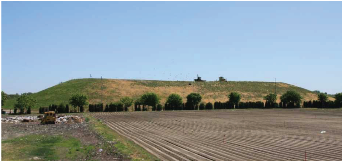
Slika 2: Odlagalište neopasnog otpada Totovec

Odlagalište neopasnog otpada Totovec nalazi se južno od grada Čakovca i udaljeno je cca 8 km (5,5 km zračne linije) od centra grada. Nalazi se na području mjesnog odbora Totovec, a smješteno je na udaljenosti cca 600 m sjeverno od naselja Totovec (Slika 2).