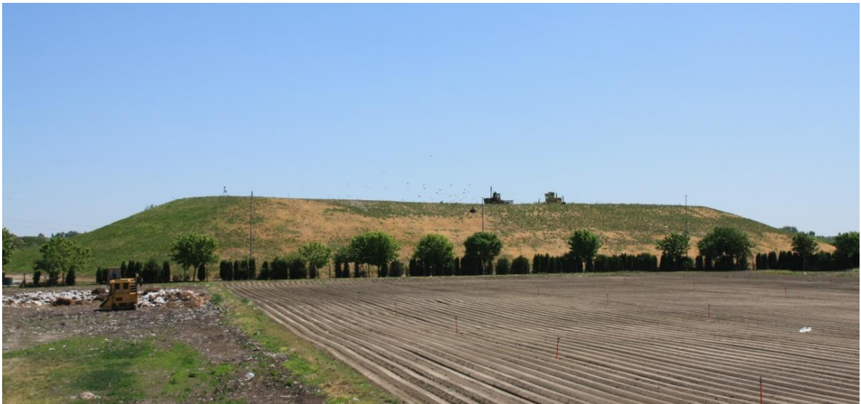
Slika 2: Odlagalište neopasnog otpada Totovec

Odlagalište neopasnog otpada Totovec nalazi se južno od grada Čakovca i udaljeno je cca 8 km (5,5 km zračne linije) od centra grada. Nalazi se na području mjesnog odbora Totovec, a smješteno je na udaljenosti cca 600 m sjeverno od naselja Totovec (Slika 2).