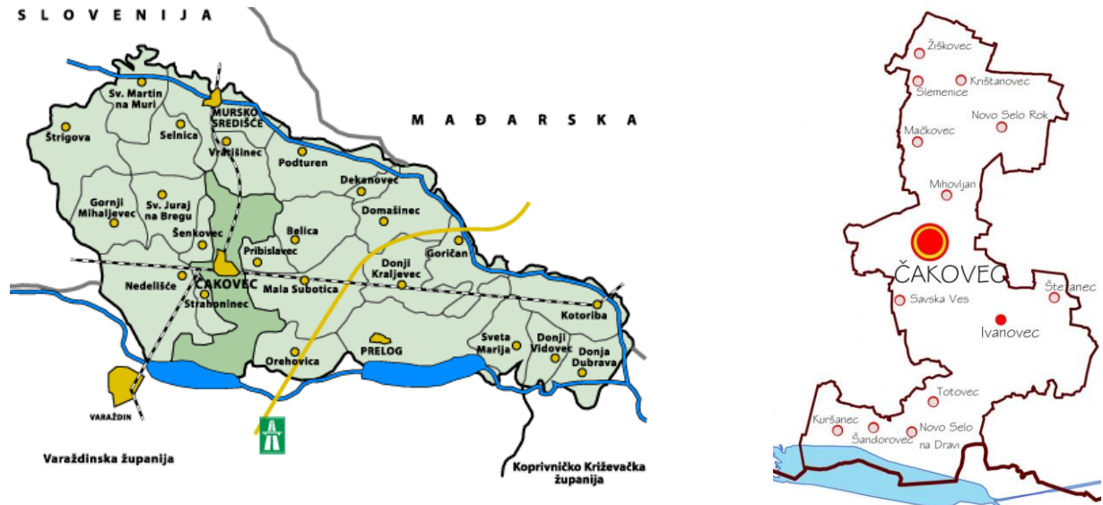
Slika 1: Položaj Grada Čakovca u Međimurskoj županiji i položaj naselja unutar Grada

Upravni odjel za komunalno gospodarstvo, izgradnju grada i upravljanje nekretninama Grada Čakovca, kao izvršno tijelo, sukladno zakonskoj obavezi iz članka 173., stavka 3. Zakona o gospodarenju otpadom (NN 84/21, 142/23) izrađuje godišnje Izvešće o provedbi Plana gospodarenja otpadom Grada Čakovca za 2023. godinu . Navedenom odredbom Zakona propisano je da jedinica lokalne samouprave dostavlja godišnje izvješće o provedbi Plana gospodarenja otpadom jedinici područne (regionalne) samouprave do 31. ožujka tekuće godine za prethodnu kalendarsku godinu i objavljuje ga u svom službenom glasilu.