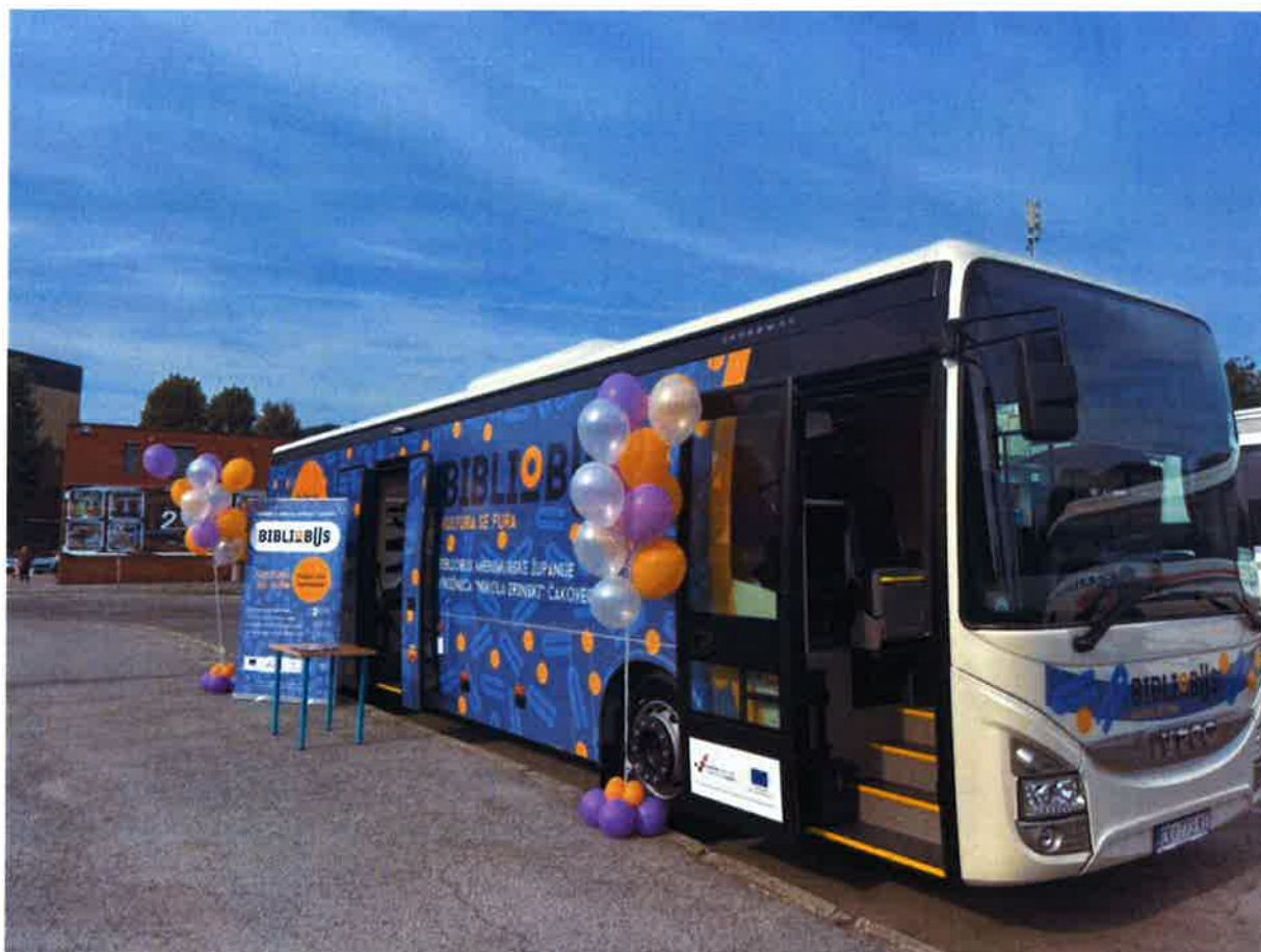
Novi bibliobus stigao je 13.09.2023.

Kompletan financijski prikaz poslovanja nalazi se u izvješću (str.30)