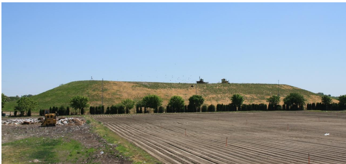
Slika 2: Odlagalište neopasnog otpada Totovec

Odlagalište neopasnog otpada Totovec nalazi se južno od grada Čakovca i udaljeno je cca 8 km (5,5 km zračne linije) od centra grada. Nalazi se na području mjesnog odbora Totovec, a smješteno je na udaljenosti cca 600 m sjeverno od naselja Totovec (Slika 2).