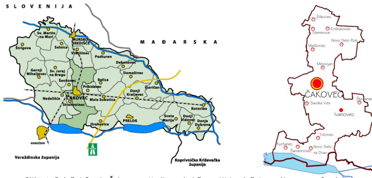
Slika 1: Položaj Grada Čakovca u Međimurskoj županiji i položaj naselja unutar Grada

Upravni odjel za komunalno gospodarstvo, izgradnju grada i upravljanje nekretninama Grada Čakovca, kao izvršno tijelo, sukladno zakonskoj obavezi iz članka 173., stavka 3. Zakona o gospodarenju otpadom (NN 84/21) izrađuje godišnje Izvešće o provedbi Plana gospodarenja otpadom Grada Čakovca za 2022. godinu . Navedenom odredbom Zakona propisano je da jedinica lokalne samouprave dostavlja godišnje izvješće o provedbi Plana gospodarenja otpadom jedinici područne (regionalne) samouprave do 31. ožujka tekuće godine za prethodnu kalendarsku godinu i objavljuje ga u svom službenom glasilu.