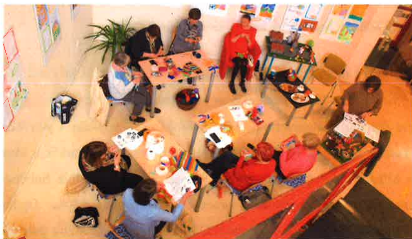
Heklice – jedna radionica u Knjižnici

S ciljem promicanja ženskog zdravlja, podijeljene su brošure s preporučenom literaturom za žene i žensko zdravlje koje su distribuirane po ginekološkim ambulantomama Doma zdravlja Čakovec.