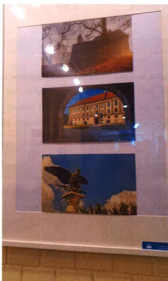
Davorin Mance : Moj Čakovec – izložba fotografija

Kompletan financijski prikaz poslovanja nalazi se u izvješću (str.26.)