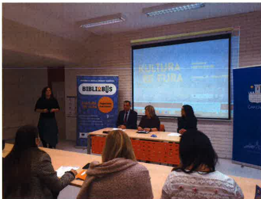
ODRŽANA POČETNA KONFERENCIJA PROJEKTA "KULTURA SE FURA"