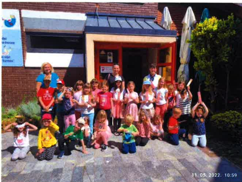
Uz Dan obitelji posjetila nas je skupina djece Montessori programa Male Perlice.

Udruga odgajatelja „Krijesnice” je u sklopu programa podrške odgojno obrazovnim djelatnicima, roditeljima i djeci na putu razvoja kvalitete rada u ranom predškolskom sustavu održala 4 radionice na kojima je sudjelovalo 25 djece u dobi od 4 do 10 godina starosti. Program „Zajedno do održivosti” Radionice s djecom kao i na radionicu gdje će roditelji imati priliku suradnički učiti sa svojim djetetom. Aktivnosti za djecu uključuju rad s prirodnim materijalima u svrhu izrade kazališta lutaka u kojem će djeca imati prilike graditi suradničke odnose. Recikliranjem starih predmeta iz obiteljskog okruženja u svrhu osmišljavanja društvenih igara potiče se kreativnost djece te senzibilitet za očuvanje okoliša kao i održivost socijalnih odnosa.