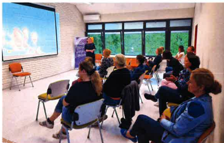
Psihološke radionice za roditelje

Održana su 3 „Čitateljsko-istraživačka izazova” u kojima je cilj bio uz pomoć ponuđenih online i tiskanih izvora informacija doći do traženih odgovora vezanih uz zadane teme, sudjelovalo je 12 natjecatelja: „Svjetski dan poezije – uz inspirativne stihove Vesne Parun” na kojem su korisnici trebali napisati pjesmu na istu temu; ČITAMO EKOPRIČE - preporukama eko priča, slikovnica, romana želi se djecu potaknuti na čitanje, ali i na promišljanje o okolišu u kojem žive, njegovu zaštiti i suživot s prirodom; DAN GRADA – ČITATELJSKO FOTOGRAFSKI IZAZOV (sudionici su trebali prošetati gradom, istražiti grad, napraviti selfi te istražiti nešto o predmetu ili osobi s kojom su se slikali).