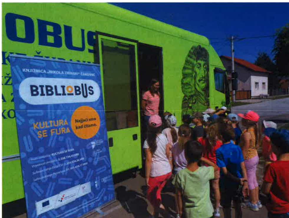
„Kultura se fura“ s jedne od radionica

Bibliobusna služba, koja djeluje u Međimurju od 1979. godine, i ove je godine omogućavala dostupnost znanju i informacijama svim stanovnicima Međimurske županije bez obzira na udaljenost, imovinsku i socijalnu situaciju. Bibliobus je svakodnevno kretao na teren s fondom od cca. 4.000 svezaka. U svom dvotjednom ciklusu prema ustaljenom rasporedu obilazio je 32 stajališta .