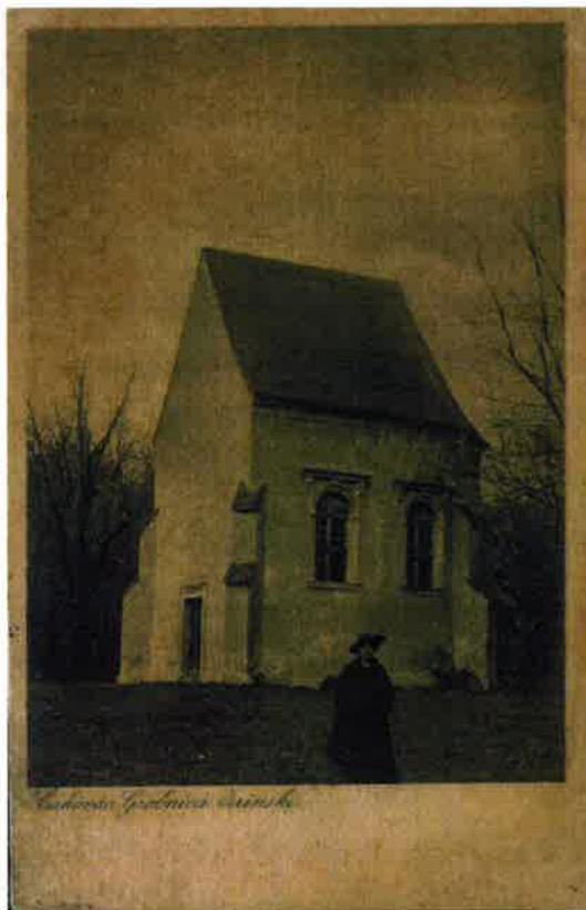
Šenkovec, grobnica Zrinskih – zbirka starih fotografija i razglednica

Fond Zavičajne zbirke u 2022. godini obogaćen je sa 127 jedinica građe. Na trajno čuvanje, osim tjedne lokalne periodike (Međimurje, Međimurske novine, Regionalni tjednik ...) ušla su i ovogodišnja izdanja školskih novina. Digitalizirala se građa ili je preuzimana s web izvor o Međimurju, čime se olakšava pronalazak građe i informacija o Međimurju.