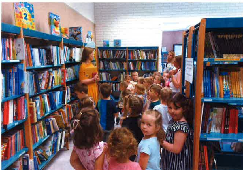
Vrtić Maslačak iz Murskog Središća

Održano je 6 Psiholoških radionica za roditelje pod vodstvom psihologinje Jelene Klinčević na kojima je sudjelovalo 120 odraslih .