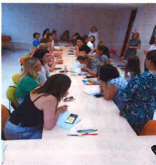
„Učimo hrvatski jezik“ - izbjeglice iz Ukrajine

U Knjižnici se već tradicionalno u suradnji s udrugom STRIPoblaČAK održava festival stripa . Na ovogodišnjem festivalu sudjelovalo je 46 odraslih osoba i 8 djece.